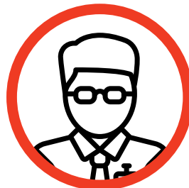
Emmanuel Pierre Incubateur Inizia