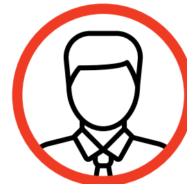
Pascal Agostini Kedge Business School